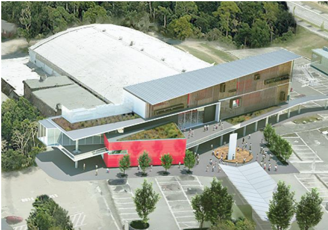
Idrottens hus vid Vallentuna IP.

Kulturhuset har ökat "vi-känslan" för oss Vallentunabor. Idrottens hus lokaler skulle vara av samma klass som Kulturhuset och träningsanläggningar skulle kunna byggas för åretruntrutning för friidrotten, fotbollen och isföreningarna. Skisser för hur ett sådant Sport- och Fritidscentrum med Idrottens Hus skulle kunna se ut presenterades på IP-rådets möte (6).